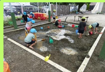
好きな遊びをする