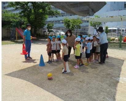
体を動かして遊ぼう