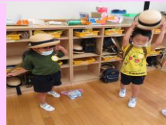
所持品の始末をする