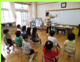
降園前の活動をする