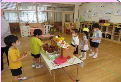
好きな遊びをする